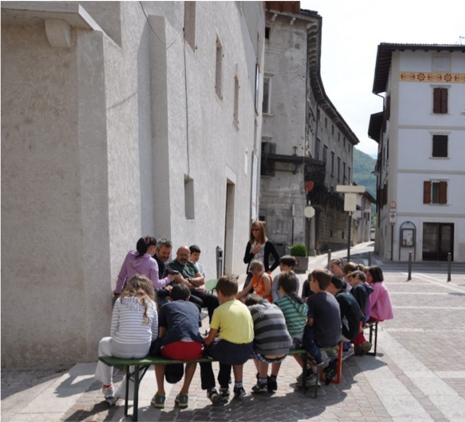
Fig. 6 Laboratorio Narrare il territorio, 2011