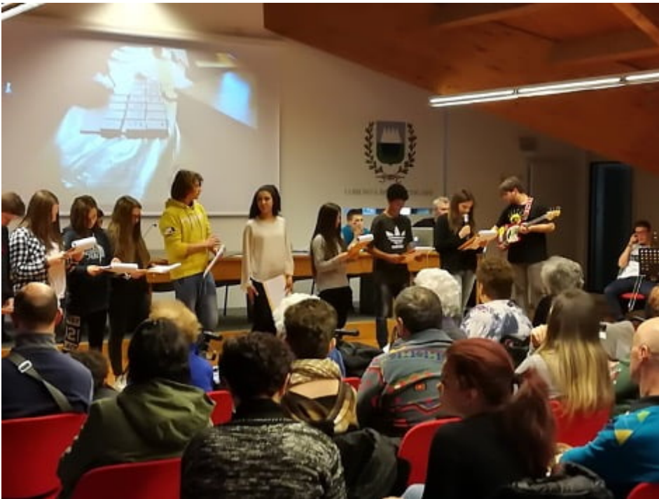
Fig. 8 Laboratorio Narrazione sensibili, 2018

Come? Attraverso degli storytelling guidati, rappresentazioni sceniche, multimediali, dove gli stessi protagonisti della raccolta sono invitati assieme ai testimoni a raccontare la loro esperienza dello stare insieme dentro un progetto di scuola attiva nel territorio. [xi]