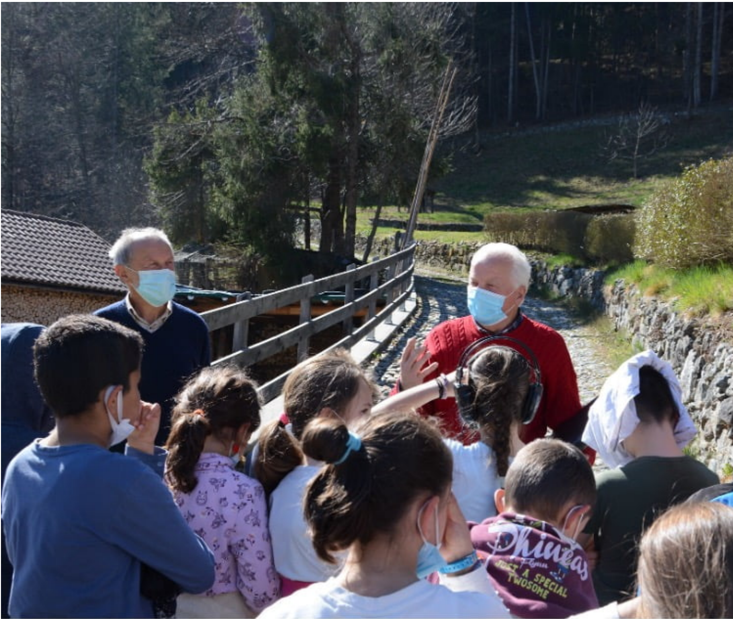
Fig. 5 Laboratorio "Ascolto di terre", 2021

Ecco la conoscenza e consapevolezza di ciò che ci circonda.