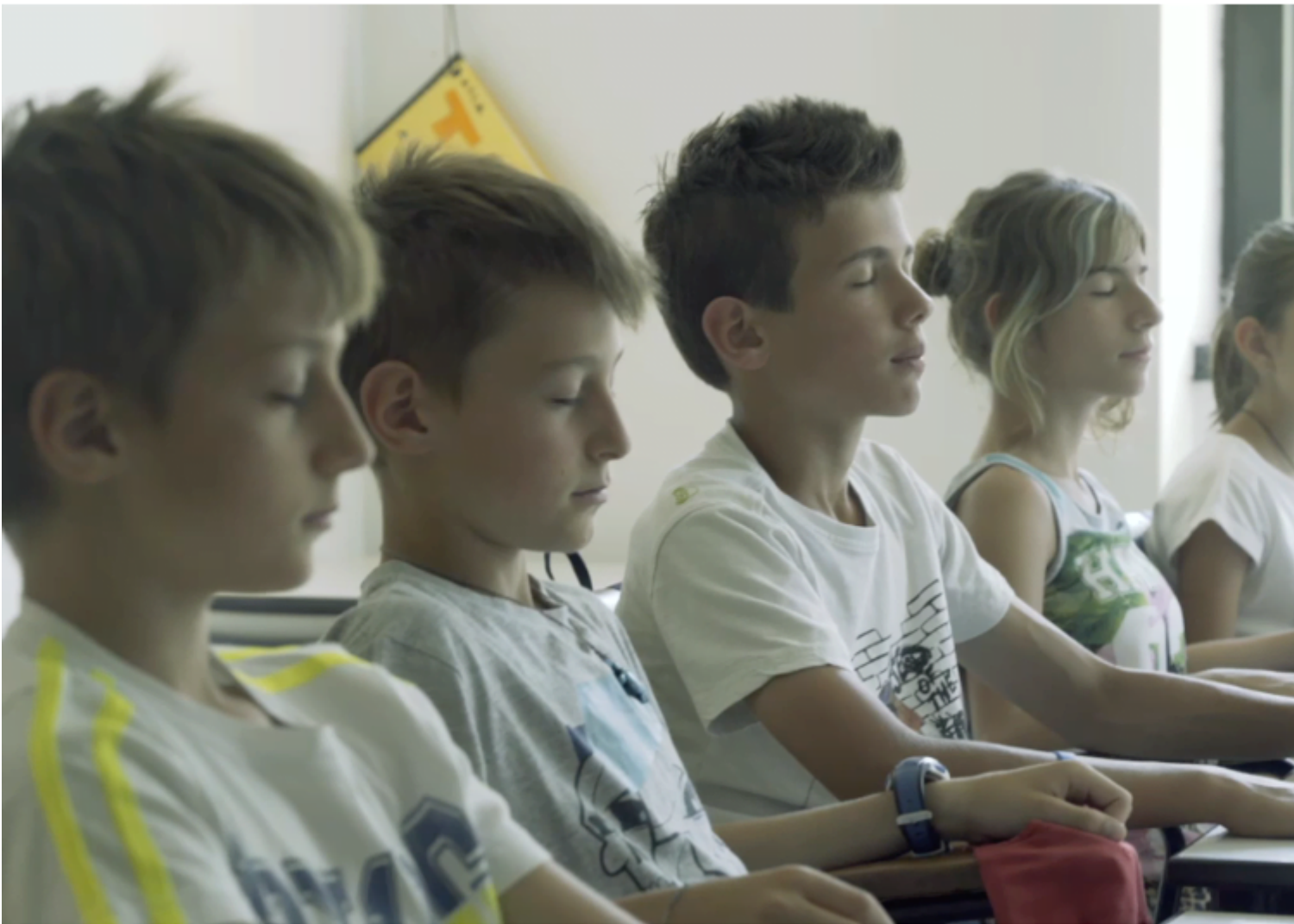
Fig. 3 Still frame dal documentario "I custodi dei suoni", 2017

Pratiche che si ispirano agli studi di Murray Schaefer, inventore del paesaggio sonoro, e di Hildegard Westerkamp, artista e ricercatrice sull'infinitamente piccolo e sulla nostra disponibilità verso il mondo, sulla dimensione psicologica e psicoaudiofonologica.