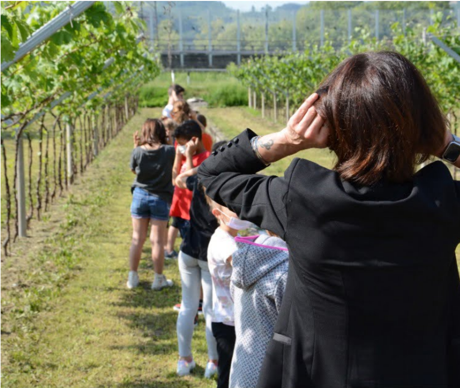
Fig. 1 Laboratorio Ascolto Nomi, Vallalagarina 2022

La filosofia dell'ascolto dei percorsi didattici particolarmente riferiti alla dimensione del paesaggio sonoro prevede un approccio pratico, esperienziale. In questa pratica, l'oggetto dell' ascoltatore è costituito dai suoni ambientali di un luogo, così come dalle sue storie, dai racconti delle persone incarnati nelle sfumature dei loro timbri, ma anche dalla morfologia stessa del paesaggio. Tutto inizia dal saper ascoltare e dal saper vedere. Entrare in contatto con un luogo significa, primariamente, mettersi in relazione: adattarsi, disporsi senza dominare; significa porsi in una relazione attenta, aperta e reciproca, dove colui che ascolta viene assorbito armonicamente nel paesaggio e al tempo stesso ne determina le sue caratteristiche con il suo atteggiamento. Tale consapevolezza favorisce una più affinata dimensione ascoltante , che sottende anche il saper trarre ispirazione da ciò che ci circonda. Ascoltare per comprendere. Si parla del recupero di un'arte smarrita, perché racchiude anche l'ascolto del mondo interiore.