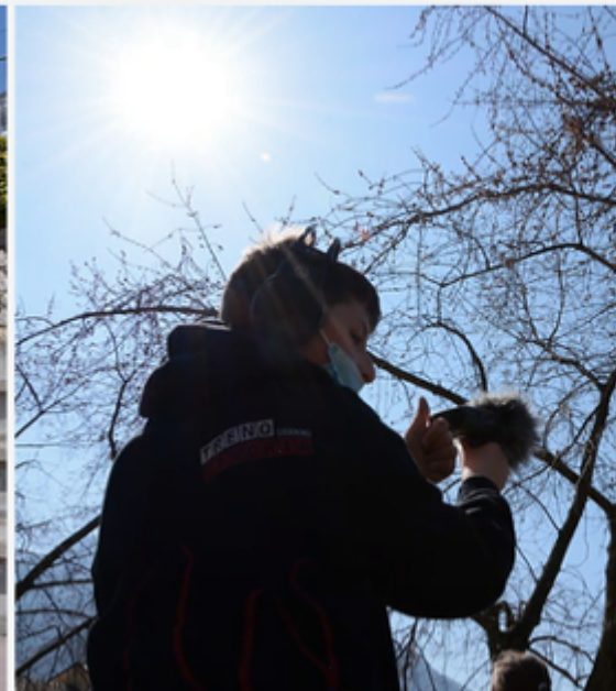
Fig. 2 Laboratorio Ascoltare Besenello 2022