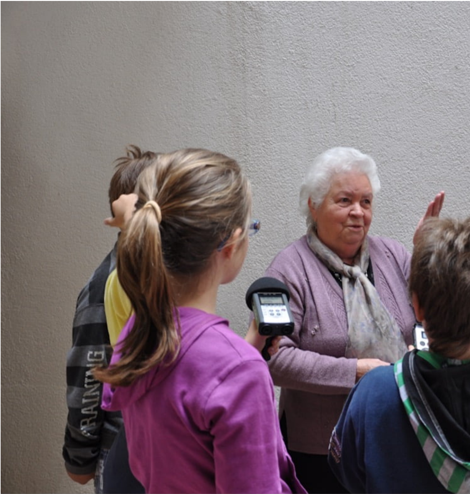
Fig. 7 Laboratorio Narrare il territorio, 2010