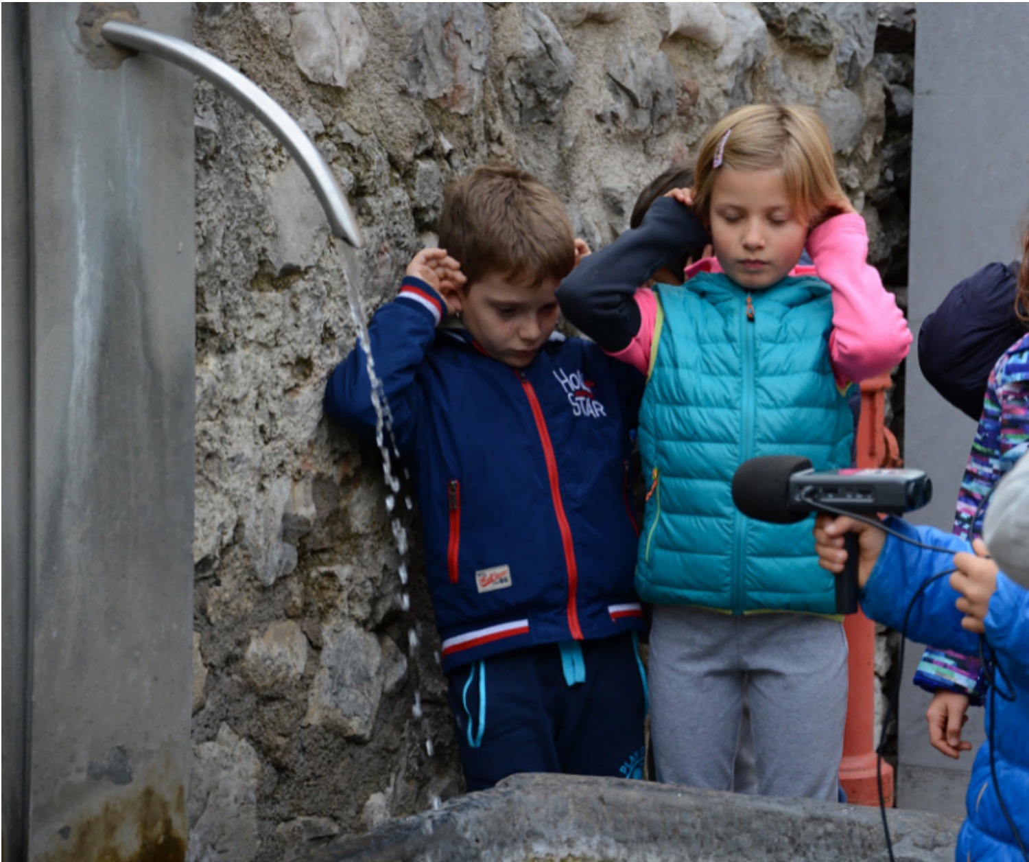
Fig. 4 Laboratorio Inventare Dro, 2016