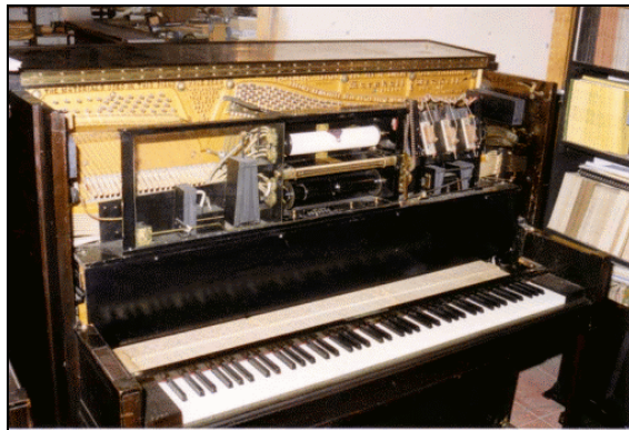
La pianola di Nancarrow

– Vorrei sottolineare fortemente che questo non è che un esempio: un modo di cominciare un discorso che poi può evolversi in molteplici direzioni. Si pensi soltanto alle poliritmie più complesse – che risultano spesso indominabili da parte degli strumentisti se non ricorrendo ad artifici come metronomi in cuffia, ed anche in questo caso con risultati esecutivi talvolta piuttosto dubbi. Il nome di Conlon Nancarrow (1912–1997) si impone da sé sia per il tipo di ricerca ritmica sia per il fatto che egli comprese la necessità di rivolgersi per la realizzazione dei suoi progetti alla pianola meccanica (Serra, 2008).