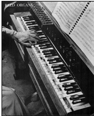
Chromelodeon I (Partch, 1949)

Non meno esemplare da questo punto di vista è il nome di Harry Partch (1901–1974). Già nel primo quarto del secolo XX si cominciarono a compiere esperimenti che prevedevano l'impiego di quarti o dei terzi di tono, ma essi ebbero breve respiro, forse perché alla fine ritenuti poco interessanti musicalmente, forse per le difficoltà esecutive che essi non potevano che presentare. Harry Partch dovette escogitare strumenti appositi per riprendere forme scalari estranee al sistema temperato ed in particolare per l'ottava suddivisa in 43 microtoni.