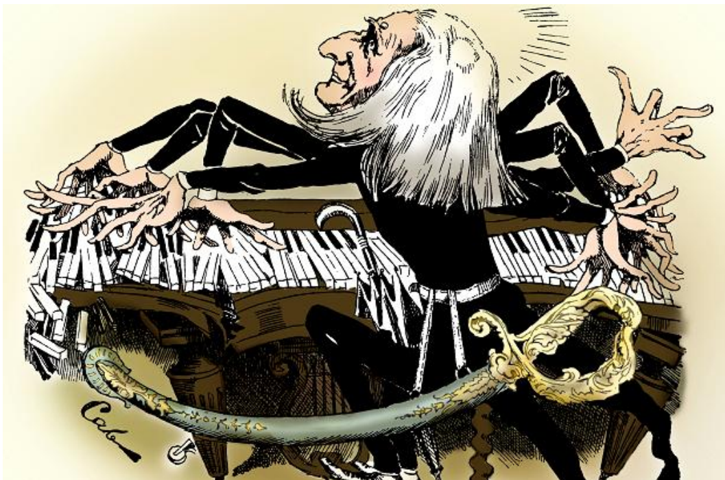
Caricatura di Liszt al pianoforte: il musicista viene rappresentato con otto braccia a sottolinearne il grande virtuosismo